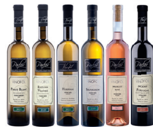
KOLEKCE Č. 2 VINAŘSTVÍ VINOFOLO