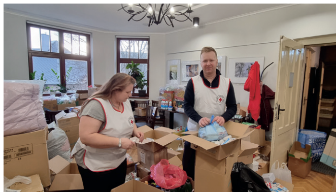
Centrum sociální pomoci v Červeném kříži Ústí nad Orlicí.

Děkujeme všem dárcům, kteří projevili dobrou vůli, a prostřednictvím prodejen sítě KONZUM věnovali min. částku 30 Kč na zajímavé a potřebné projekty, které pomohou ke zkvalitnění života mnoha lidem. Těší nás, že i v této nelehké době počet příspěvků dosáhl téměř 8 000 a společně se nám podařilo získat částku 237 510 Kč. Obchodní družstvo KONZUM pak dle poměrů, o kterých rozhodli zákazníci, rozdělilo neziskovým organizacím dalších 200 000 Kč z vlastních zdrojů. Konečná částka se tak vyšplhala na 437 510 Kč .