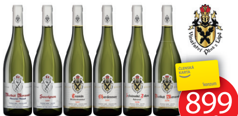
KOLEKCE Č. 1 VINAŘSTVÍ PÁNŮ Z LIPÉ

Objednejte do 16. 3. 2023, nakupte od 3. 4. 2023.